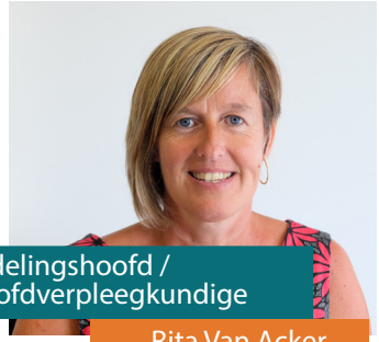
Afdelingshoofd / hoofdverpleegkundige

Om je goede zorg te kunnen geven, volgen we nauw op welke behoeften jij hebt en hoe deze evolueren. We doen dit samen met jou, je familie en verschillende specialisten. Deze specialisten hebben ieder hun vakgebied en kennis. Op deze pagina zie je er een overzicht van.