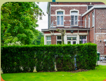
PVT De Villa