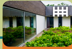
High Risk Vrouwen Opname Unit Levanta