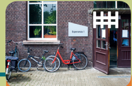
Long-Care Unit Long-Treatment Unit Esperanza 1