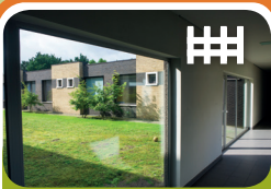
Opname Unit Encarga 1