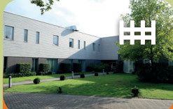
Intensieve Behandel Unit Encarga 2