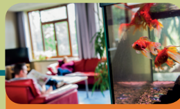
Intensieve Behandel Unit Encarga 3