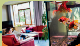
Intensieve Behandel Unit Encarga 3