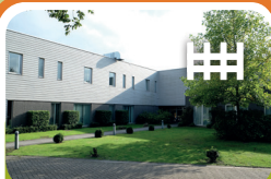
Intensieve Behandel Unit Encarga 2