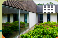
High Risk Vrouwen Opname Unit Levanta