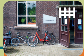
Long-Care Unit Long-Treatment Unit Esperanza 1