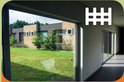
Opname Unit Encarga 1