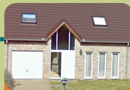
Forensische Extern Beschutz Wohnen