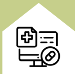
Extern netwerk van drughulpverlening