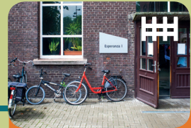
Long-Care Unit Long-Treatment Unit Esperanza 1