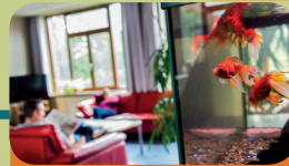
Intensieve Behandel Unit Encarga 3