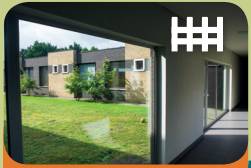
Opname Unit Encarga 1