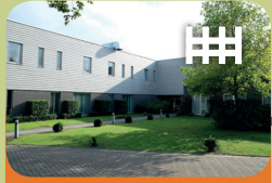
Intensieve Behandel Unit Encarga 2