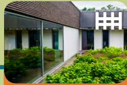
High Risk Vrouwen Opname Unit Levanta