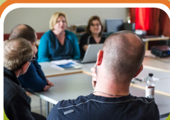
Forensische dagkliniek Ligarsa