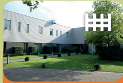
Intensieve Behandel Unit Encarga 2