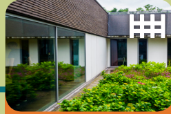
High Risk Vrouwen Opname Unit Levanta