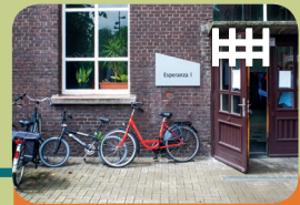
Long-Care Unit Long-Treatment Unit Esperanza 1