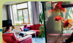
Intensieve Behandel Unit Encarga 3