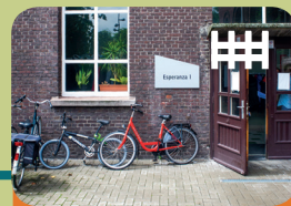
Long-Care Unit Long-Treatment Unit Esperanza 1