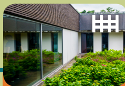
High Risk Vrouwen Opname Unit Levanta