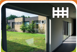
Opname Unit Encarga 1