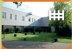
Intensieve Behandel Unit Encarga 2