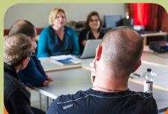
Forensische dagklinik Ligarsa