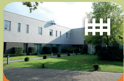
Intensieve Behandeln Unit Encarga 2