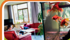
Intensieve Behandeln Unit Encarga 3