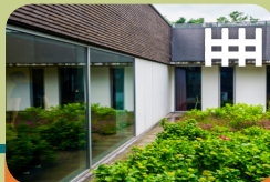
High Risk Vrouwen Opname Unit Levanta