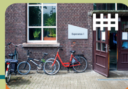
Long-Care Unit Long-Treatment Unit Esperanza 1