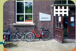
Long-Care Unit Long-Treatment Unit Esperanza 1