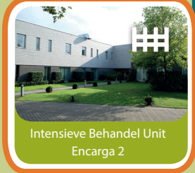
Intensieve Behandel Unit Encarga 2