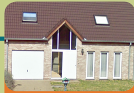
Forensische Extern Beschut Wonen