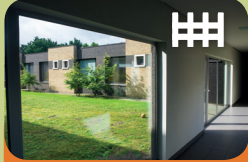
Opname Unit Encarga 1