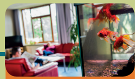
Intensieve Behandel Unit Encarga 3