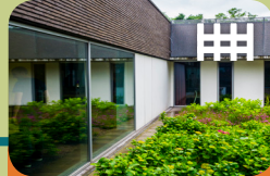
High Risk Vrouwen Opname Unit Levanta