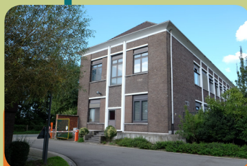
PVT Het Anker