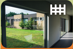
Opname Unit Encarga 1