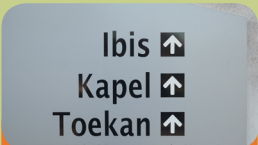
Forensische Intern Beschut Wonen