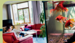
Intensieve Behandel Unit Encarga 3