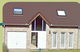
Forensische Extern Beschut Wonen