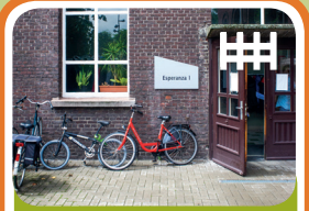
Long-Care Unit Long-Treatment Unit Esperanza 1