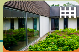
High Risk Vrouwen Opname Unit Levanta