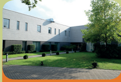
Intensieve Behandel Unit Encarga 2