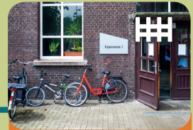
Long-Care Unit Long-Treatment Unit Esperanza 1