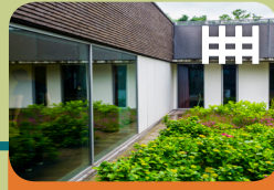
High Risk Vrouwen Opname Unit Levanta