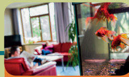
Intensieve Behandeling Unit Encarga 3