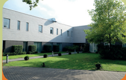
Intensieve Behandeling Unit Encarga 2