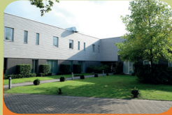
Intensieve Behandel Unit Encarga 2