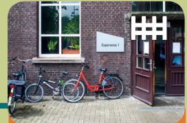
Long-Care Unit Long-Treatment Unit Esperanza 1