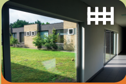
Opname Unit Encarga 1