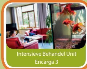
Intensieve Behandel Unit Encarga 3