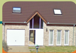
Forensische Extern Beschut Wonen