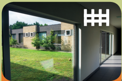
Opname Unit Encarga 1