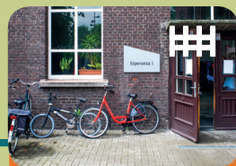
Long-Care Unit Long-Treatment Unit Esperanza 1