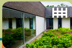
High Risk Vrouwen Opname Unit Levanta