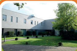
Intensieve Behandel Unit Encarga 2