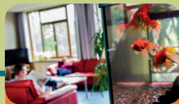
Intensieve Behandel Unit Encarga 3