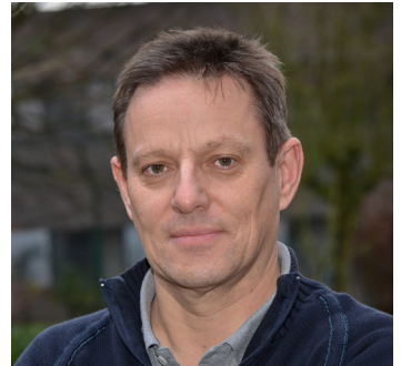
Afdelingshoofd Vespera ad interim